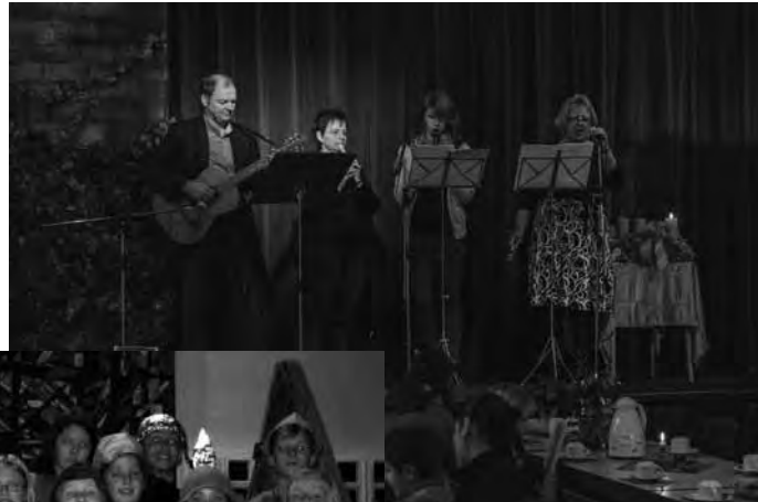
oben: Die Nikolausband bei der großen Nikolausfeier

unten: Adventskonzert der St. Ursula-Schule in der Lukaskirche