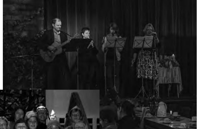
oben: Die Nikolausband bei der großen Nikolausfeier

unten: Adventskonzert der St. Ursula-Schule in der Lukaskirche