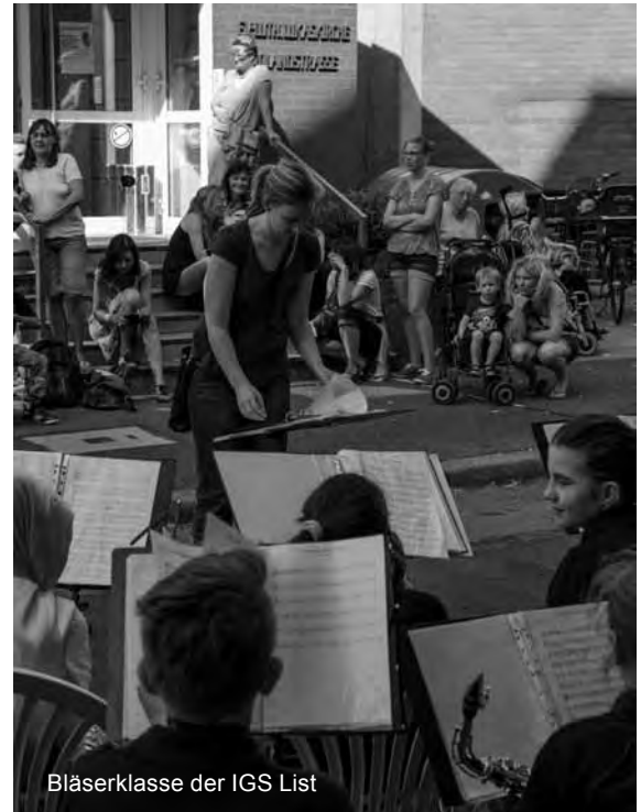
Bläserklasse der IGS List