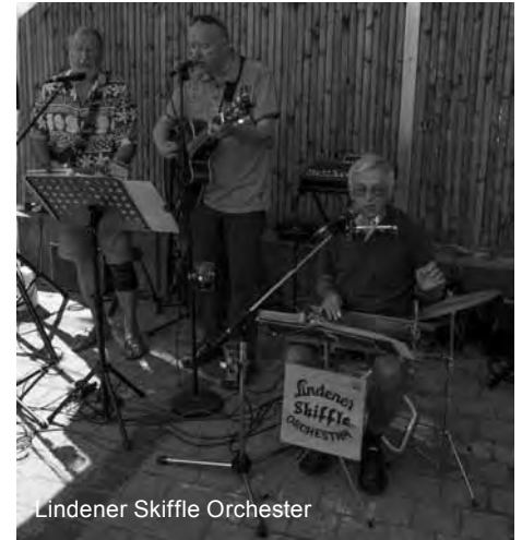
Lindener Skiffle Orchester