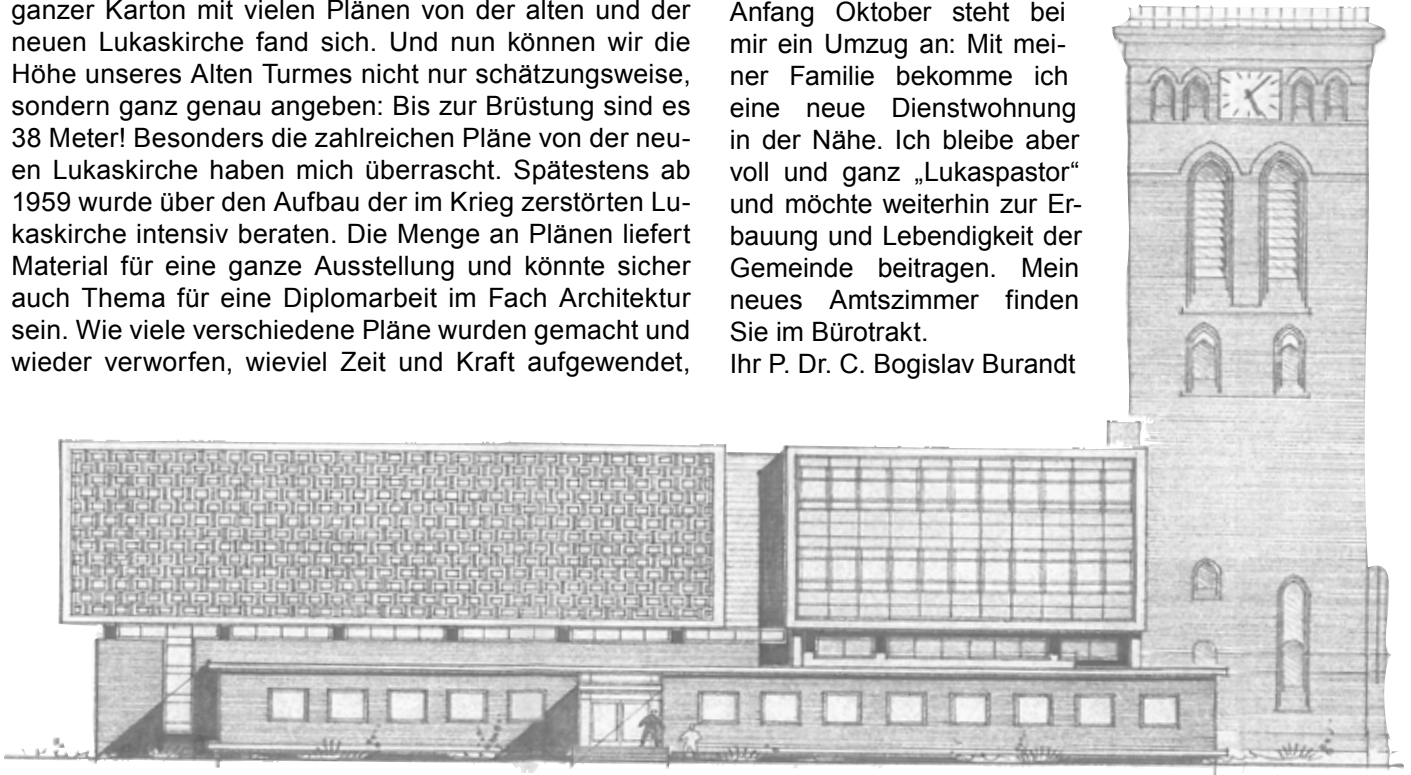
Einer der zahlreichen unverwirklichten Entwürfe für die neue Lukaskirche.