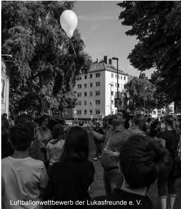
Luftballonwettbewerb der Lukasfreunde e. V.