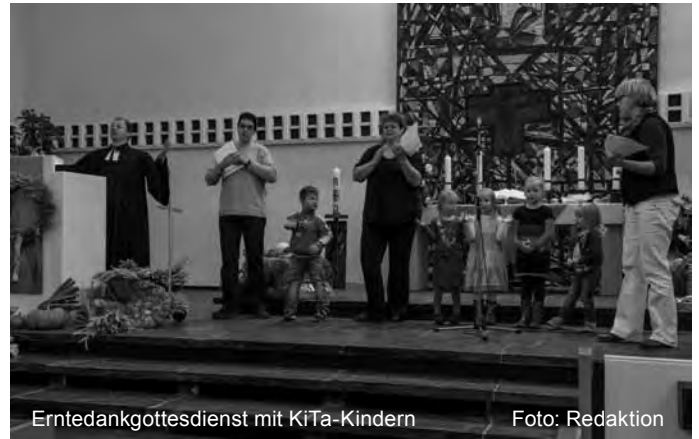
Erntedankgottesdienst mit KiTa-Kindern

Richtung Laternenzeit! Froschlaternen wurden wochenlang mit viel Geduld, Eifer und Freude gebastelt. Wunderschön! Natürlich haben wir auch Laternenlieder geschmettert, denn es ging auf den großen Laternenumzug zu, jedes Jahr ein Highlight des Herbstes! Was noch alles an unserem kleinen Teich passierte, ist eine andere Geschichte und soll ein anderes Mal erzählt werden. Wir verbleiben mit dem vertrauten Quak, Quak und wünschen Ihnen eine wunderschöne Adventszeit! Ihre Frösche