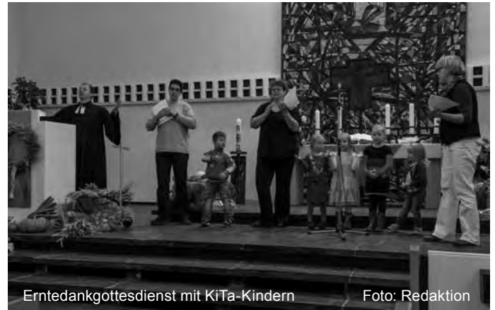
Erntedankgottesdienst mit KiTa-Kindern

Richtung Laternenzeit! Froschlaternen wurden wochenlang mit viel Geduld, Eifer und Freude gebastelt. Wunderschön! Natürlich haben wir auch Laternenlieder geschmettert, denn es ging auf den großen Laternenumzug zu, jedes Jahr ein Highlight des Herbstes! Was noch alles an unserem kleinen Teich passierte, ist eine andere Geschichte und soll ein anderes Mal erzählt werden. Wir verbleiben mit dem vertrauten Quak, Quak und wünschen Ihnen eine wunderschöne Adventszeit! Ihre Frösche