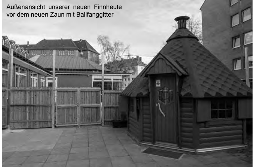
Außenansicht unserer neuen Finnheute vor dem neuen Zaun mit Ballfanggitter