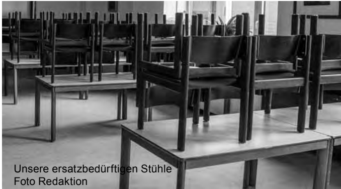
Unsere ersatzbedürftigen Stühle

„Wie man sich bettet, so liegt man“, heißt es im Volksmund. Und gemeint ist damit: Wer sich krumm oder voller Sorgen ins Bett wirft, der hat keinen sanften Schlaf zu erwarten. Von daher sollte man darauf achten, dass man nicht mit zu vielen Gedanken im Kopf zu Bett geht und dass Bett und Matratze für einen selber nicht zu hart oder zu weich sind. In unserer Gemeinde beschäftigen wir uns nicht mit dem Schlafen, aber sehr wohl mit Zuhören und Reden, mit Austausch und Gespräch. „Wie man