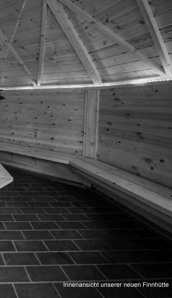
Innenansicht unserer neuen Finnhütte