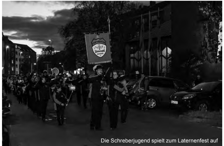
Die Schreberjugend spielt zum Laternenfest auf