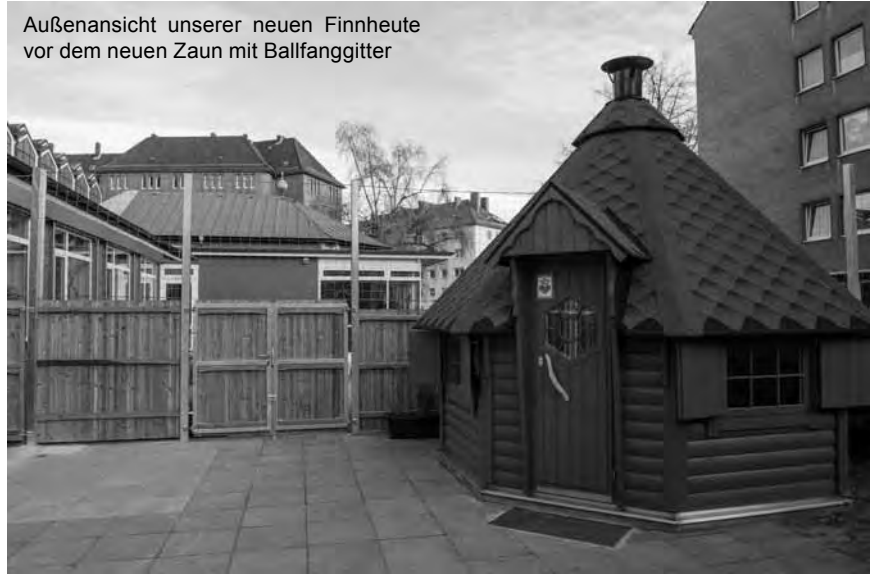
Außenansicht unserer neuen Finnheute vor dem neuen Zaun mit Ballfanggitter