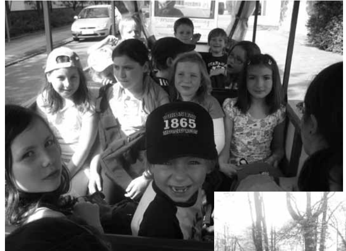
Bei der Bimmelbahnfahrt durch Celle wird es eng.