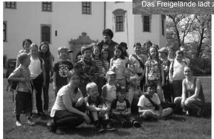
Das Freigelände lädt zu ph...