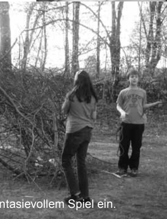
... mit viel fantasievollem Spiel ein.