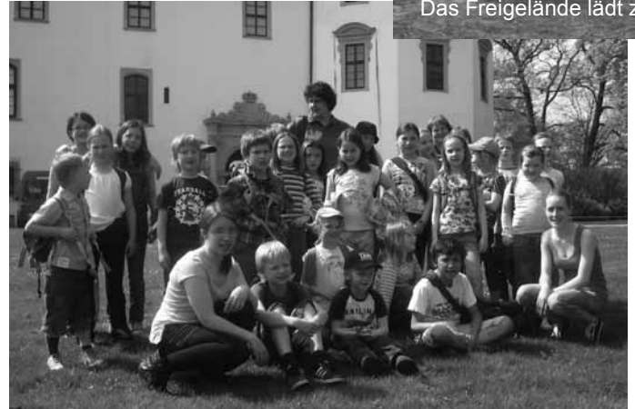
Das Freigelände lädt zu ph...