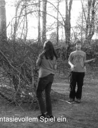
... mit viel mehr fantasievollem Spiel ein.