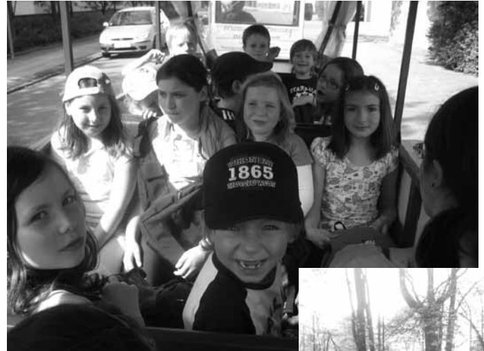
Bei der Bimmelbahnfahrt durch Celle wird es eng.