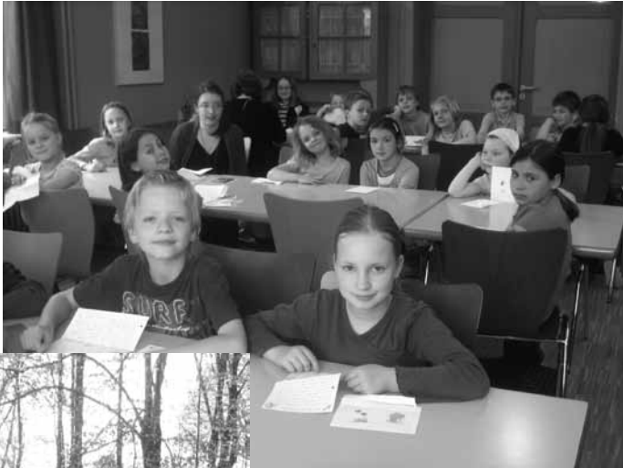
Fast wie Schule - nur viel schöner!